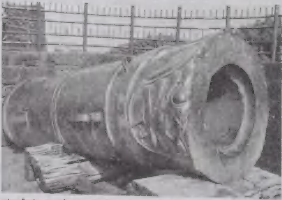
ಮಾಲಿಕ್-ಎ-ಮೈದಾನ್ ತೋಫು, ಬಿಜಾಪುರ